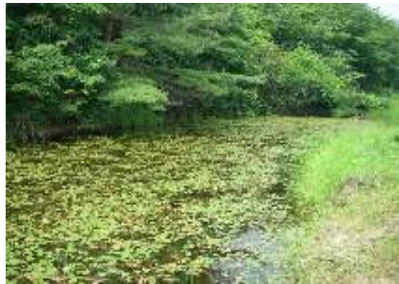
写真1-8 棚田上部の小規模な溜池