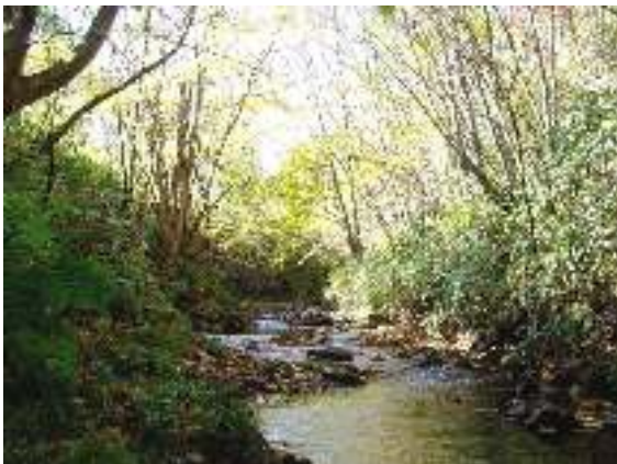
写真1-5 栃倉川上流域の景観