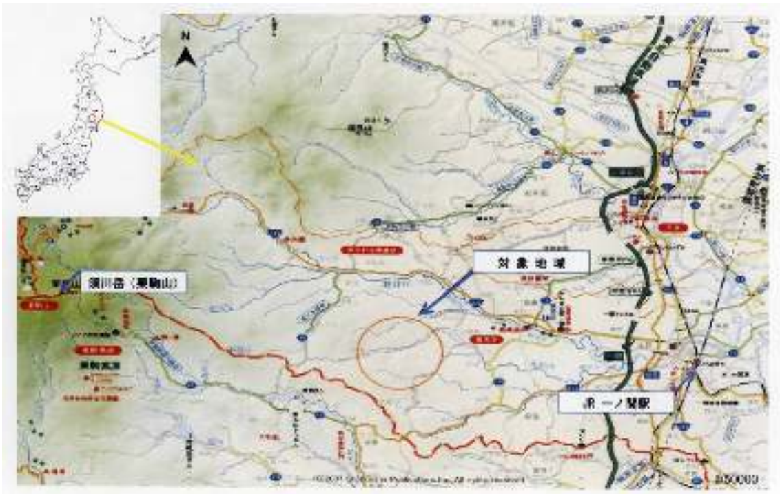
図1-1 対象地域を含む、一関市周辺の地図