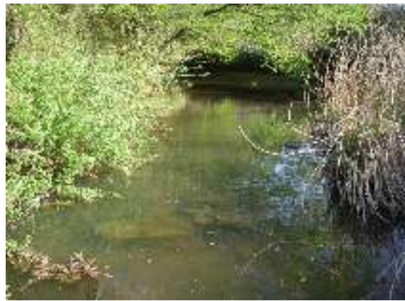
写真1-6 市野々川中流域の景観