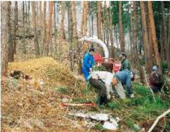
写真3-3 間伐材のチップ化 (知勝院樹木葬墓地)