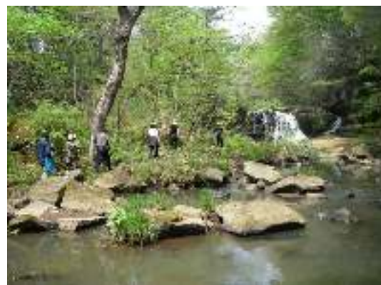
写真7-4 霜後滝に到着