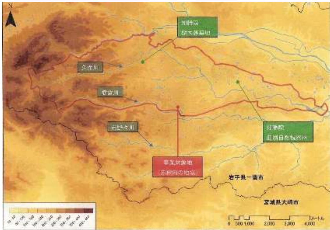
図4-1 久保川イーハトーブ自然再生事業の対象地域（赤線内の地域）

なお、宗教法人知勝院の所有地約25万平方メートル、岩手県と一関市が管理する久保川（支流栃倉川も含む）以外の地域については、所有者の利用を妨げない範囲での事業実施とする。