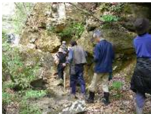
写真7-3 久保川に沿った崖下を進む