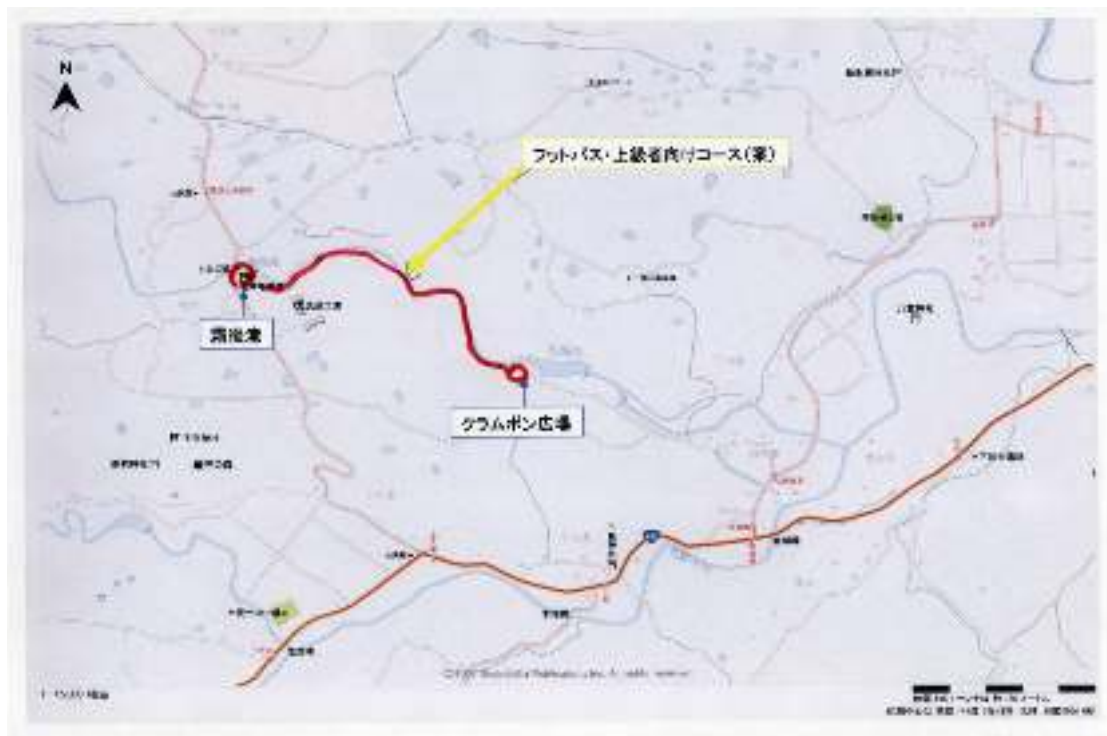
図7-1 フットパスの候補（クラムボン広場から霜後滝までの久保川に沿ったコース）