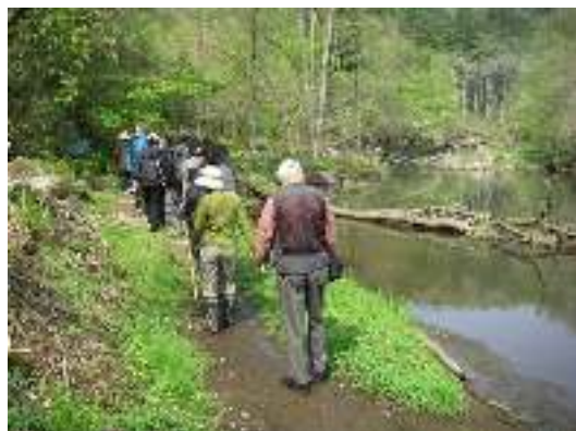
写真7-1 クラムボン広場から出発