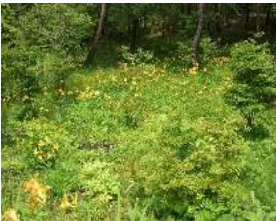
写真3-5 再生したニッコウキスゲ群落 (知勝院曲淵自然観察林)