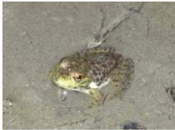
写真2-4 増加著しい外来種ウシガエル