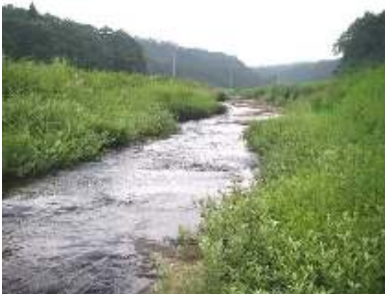
写真1-3 久保川中流域の景観