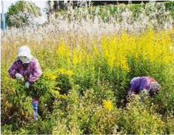
写真3-1 久保川流域におけるセイタカアワダチソウの除去作業