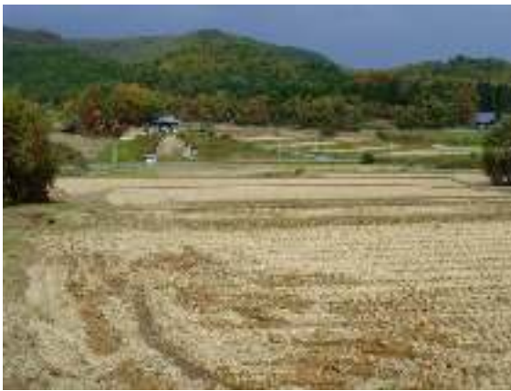
写真2-1 乾田化された水田

このように、対象地域のランドスケープは、戦後の拡大造林や土地改良事業による水田整備などを免れてきたところにその特徴がある。しかし、近年では、農業の近代化の波がこの地域の稲作にも大きな影響を与えている。すなわち、氾濫原にある水田の多くは乾田化（写真2-1）され、化学肥料や農薬の使用などの影響と相まって在来の水生生物が減少しつつある。また、経済的価値の消失により管理放棄された樹林（写真2-2）では、間伐や下草刈りが行われず、林床の植生が貧弱化している。その結果、サクラソウ（写真2-3）、サギソウ、キンラン、ミスミソウなど、地域からの絶滅が危惧される植物も少なくない。一方、道路際ではセイタカアワダチソウなどの外来植物が目立つようになり、溜池には侵略的な外来水生生物であるウシガエル（写真2-4）の侵入が始まっている。