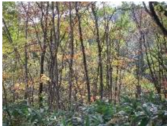
写真2-2 林床に笹が密生する放棄林