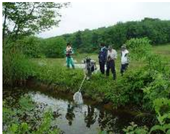
写真3-6 東京大学との協働による地域の 生物調査