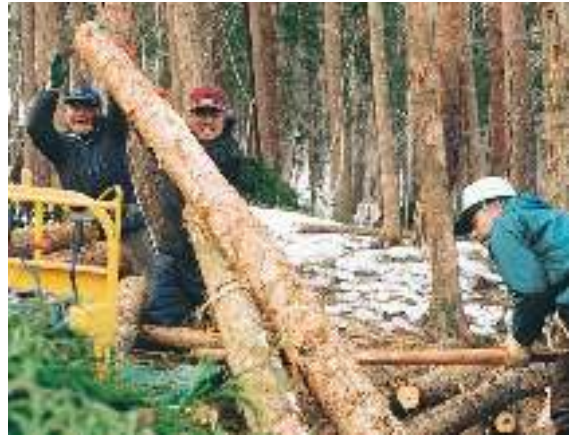
写真3-2 冬季の間伐作業 (知勝院樹木葬墓地)