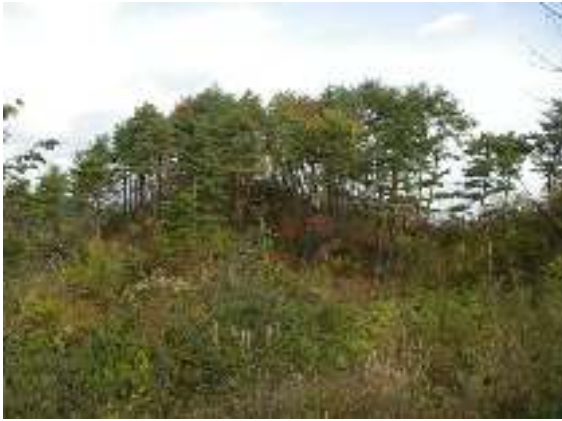
写真1-1 尾根筋のアカマツ林