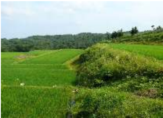
写真1-7 斜面に作られた棚田

この地域では狭い水田での稲作だけでは生活が成り立たず、傾斜地の落葉広葉樹林が雑木林として、かつては炭焼き、近年はシイタケ栽培に利用された（写真1-10）。このため、戦後の拡大造林による人工林化はあまり進まず、伝統的な伐採更新による管理がなされる雑木林が比較的最近まで維持されてきた。