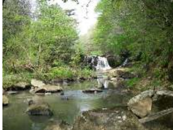
写真1-4 霜後滝（久保川）