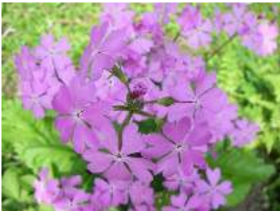
写真2-3 減少しているサクラソウ