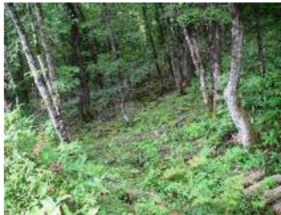
写真1-10 シイタケ栽培に利用される林