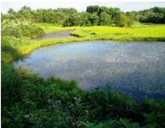
写真1-9 地域の典型的なランドスケープ