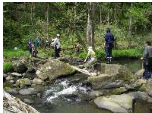
写真7-2 丸木橋を渡る