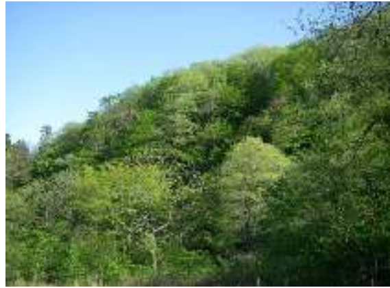
写真1-2 斜面の落葉広葉樹林