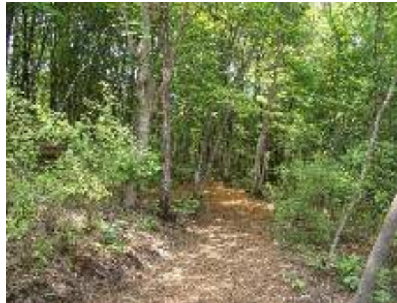
写真3-4 手入れの行き届いた林 (知勝院曲淵自然観察林)